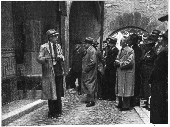
Römische Funde im Museum zu Nyon.