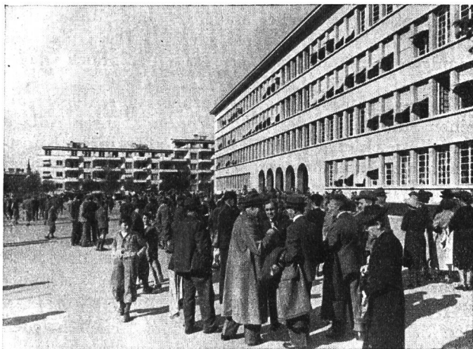
Nach der Turnübung vor der Kantonsschule in Lausanne.

Das beglückende Erlebnis der Tessinertage vom Oktober 1940 hat es ein Jahr später beiden Teilen leicht gemacht: der Leitung des Pestalozzianums, für die Herbstferien 1941 wieder eine Tagung zu planen; manchem Teilnehmer an der Tessinerfahrt, freudig ja zu sagen, als im August ein verlockendes Programm zu einer Reise ins Waadtland einlud. Zwar ist es gegangen wie immer. Neben den Entschlossenen gab es die Zaghaften, die aus dem einen und andern Grund sich erst in letzter Stunde als Mitfahrer meldeten. Dann waren es aber doch nahe an die 90 Namen, welche die Teilnehmerliste füllten, Kolleginnen und Kollegen (zum Teil mit ihren Angehörigen) aus allen Schulstuben im weiten Land. Die Zürcher Gruppe zählte 67 Leute: 38 aus der Stadt, 12 Winterthurer und 17 von der Landschaft; die Thurgauer hatten sich eingestellt (6), und Bern war da (5); St. Gallen stand neben Basel (3 und 2); Aargau, Appenzell und das Tessin meldeten sich mit je einem Vertreter, und selbst ein Altkollege aus Lausanne hatte sich für die Tagung angesagt.