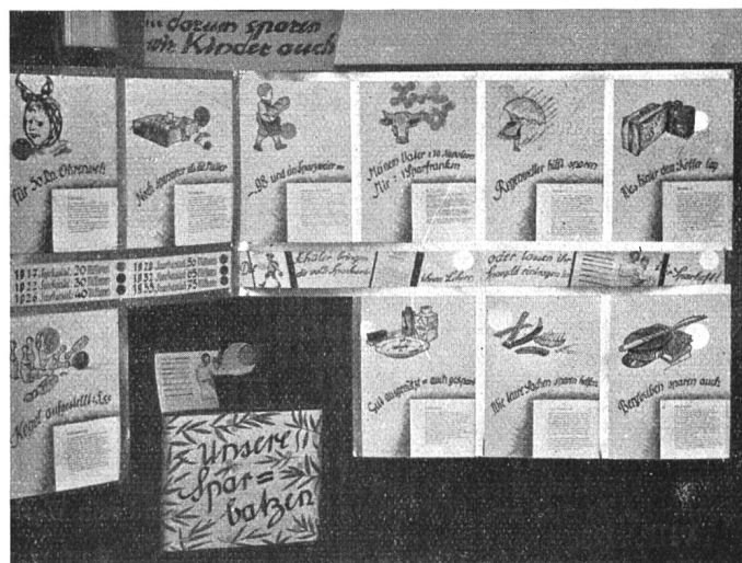
Vater und Mutter sparen, ... darum sparen wir Kinder auch.

eine Form von einem Rock aus rotem Stoff. Jetzt fing ich an zu nähen. Am Anfang ging es sehr gut, und ich meinte, ich könne und verstehe jetzt auf der Maschine zu nähen. Aber auf einmal machte es brr. Die Maschine nähte einfach nicht mehr. Ich schnitt den Faden ab und nahm den Stoff... Md. II. Sek.-Kl.