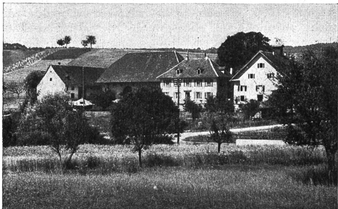
Das Stammhaus der Familie Herzog (Hauptgebäude rechts) in Effingen, heute Erziehungsanstalt für Knaben.

Der Schmerz überwältigt mich, indessen ich Ihnen diese traurige Nachricht mittheile, aber in der Zerrissenheit meines Herzens wage ich es dennoch, Sie um der Freundschaft willen, womit Sie meinen seligen Vater beehrten, zu bitten, uns fernerhin das hohe Wohlwollen zu schenken, um das Sie der Sterbende selbst so gerne für uns hätte ansprechen mögen.