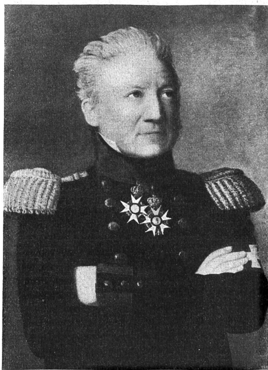
JOHANNES HERZOG, 1773–1840, Gemälde von Diogg, im Besitze von Frau J. Bally-Herzog, Schönenwerd.

Weise abzulösen. Für Herzog ist charakteristisch, dass er wiederum mitzuwirken hatte, als durch ein Gesetz die Ausnahmestellung der Juden aufgehoben werden sollte. Im Kriegsjahre 1799 amtierte der junge Staatsmann und Offizier als helvetischer Kommissär in St. Gallen, um kurz darauf in ähnlicher Stellung dem Hauptquartier Massenas zugeteilt zu werden. Eine neue Aufgabe erwartete ihn in Graubünden, dessen Anschluss an die helvetische Republik er vorzubereiten hatte. — Inzwischen war die französische Armeeleitung auf den tatkräftigen, gewandten Schweizer Offizier aufmerksam geworden; sie bot ihm das Brevet eines französischen Brigadegenerals an! Er lehnte ab, aber ein Kommissariat bei der französischen Rheinarmee hielt ihn bis in den Herbst 1800 von den Verhandlungen der helvetischen Räte fern, während sein Mandat als