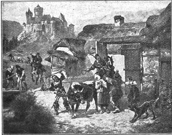
Wegnahme des Besthaupts

Das Bild stellt in einer bewegten Szene dar, wie aus einem Bauernhofe das „Besthaupt“ weggeholt wird. Ich kann mir denken, daß man die Schüler zunächst zu Beobachtern der Handlung werden läßt, um sie von da aus in die sozialen Verhältnisse jener Zeit hineinblicken zu lassen. So kann das Bild im Sinne der Arbeitsschule zum Ausgangspunkt einer kulturgeschichtlichen Betrachtung werden.