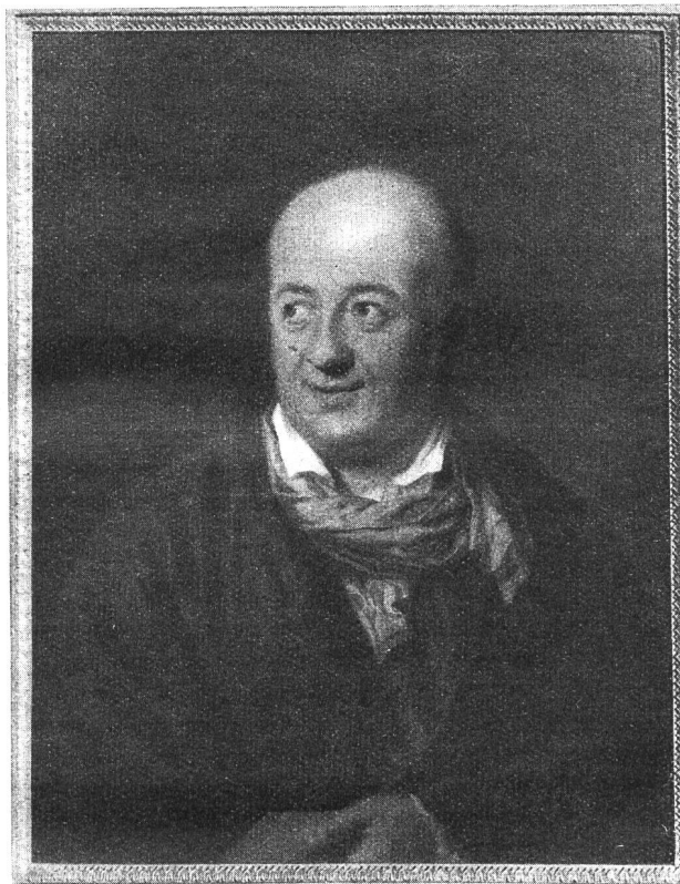
Salomon Geßner 1730–1788