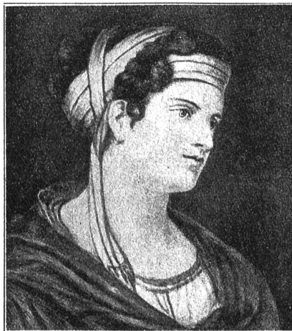
Gräfin Therese Brunszvik Originalgemälde im Beethovenhaus in Bonn

Die diesjährigen Jahrhundertfeiern Pestalozzis und Beethovens haben die Aufmerksamkeit der Kulturwelt auf eine Frauengestalt gelenkt, die mit beiden unsterblichen Größen in unmittelbarem Verkehr gestanden ist. Durch Beethoven wurde sie zur «unsterblichen Geliebten» geweiht, durch Pestalozzi zum «unsterblichen Schutzengel» der Kinderwelt. Während jedoch das Problem «Beethoven-Brunszvik» in der aus-