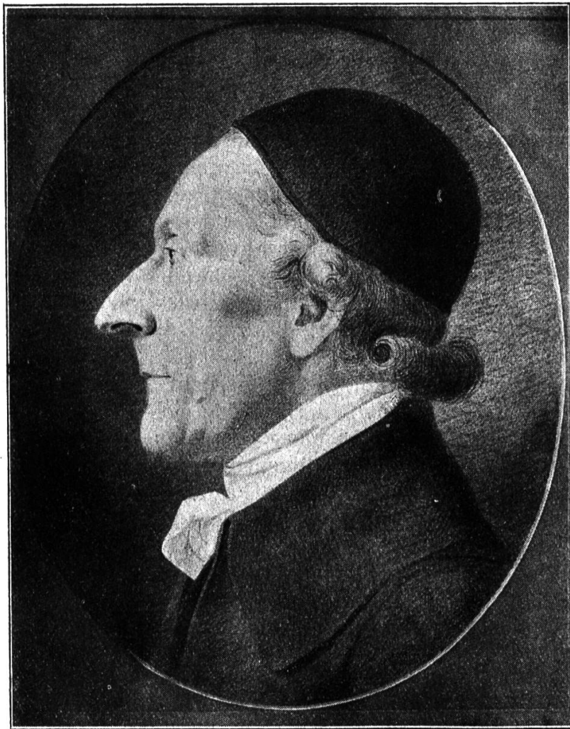
Ein wenig bekanntes Lavaterbild.

Inhalt: Lavater und Pestalozzi. — Drei Beiträge zur Pestalozziforschung. — Vom Lichtbilderdienst des Pestalozzianums. — Aus dem Pestalozzianum. — Neue Bücher - Bibliothek.