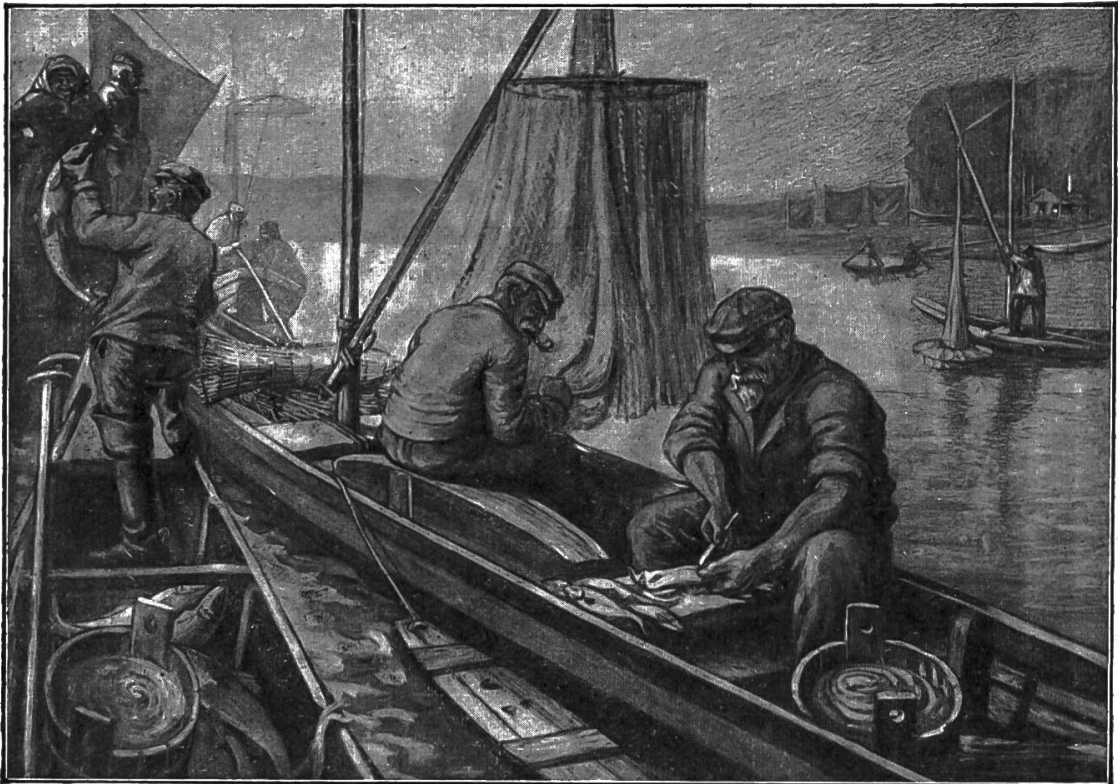
Nr. 11. Der Flussfischer.

2. Meinholds Handwerkerbilder. Der Inhalt dieser für den elementaren Anschauungsunterricht und die Heimatkunde bestimmten Bildersammlung ist folgender Nr. 1. Schmiede. Nr. 2. Tischler (Schreiner). Nr. 3. Schuhmacher. Nr. 4. Schneider. Nr. 5. Bäcker (Pfister). Nr. 6. Töpfer (Hafner). Nr. 7. Klempner (Spengler). Nr. 8. Böttcher (Küfer).