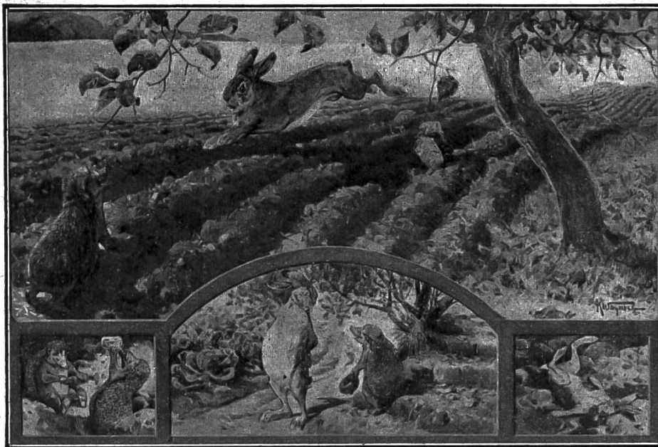
Nr. 18. Der Hase und der Igel.

1. Meinholds deutsche Märchenbilder. Dresden, Meinhold & Söhne. Diese Bilderserie (vergl. Nr. 9, 1912 d. Bl.) ist zu einer stattlichen Sammlung von 18 Nummern angewachsen. Es sind ohne Ausnahme Darstellungen, die durch Inhalt und Farbe Herz und Sinn der märchenliebenden Jugend gefangen nehmen. Als neueste Erscheinung liegt uns vor: