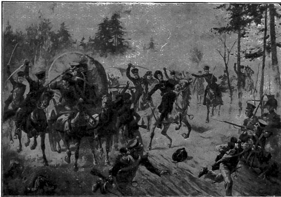
Nr. 1. Theodor Körners Tod bei Gadebusch.

2. Als willkommene Ergänzung zu Nr. 1 der genannten Bilder ist soeben ein Kunstblatt erschienen, das uns ebenfalls in die grosse Zeit der deutschen Befreiungskriege vor hundert Jahren zurückversetzt und sicher von den Schulen gerne angeschafft werden wird, sei es als Bestandteil der Lehrmittelsammlung, sei es als Wandschmuck. Es ist