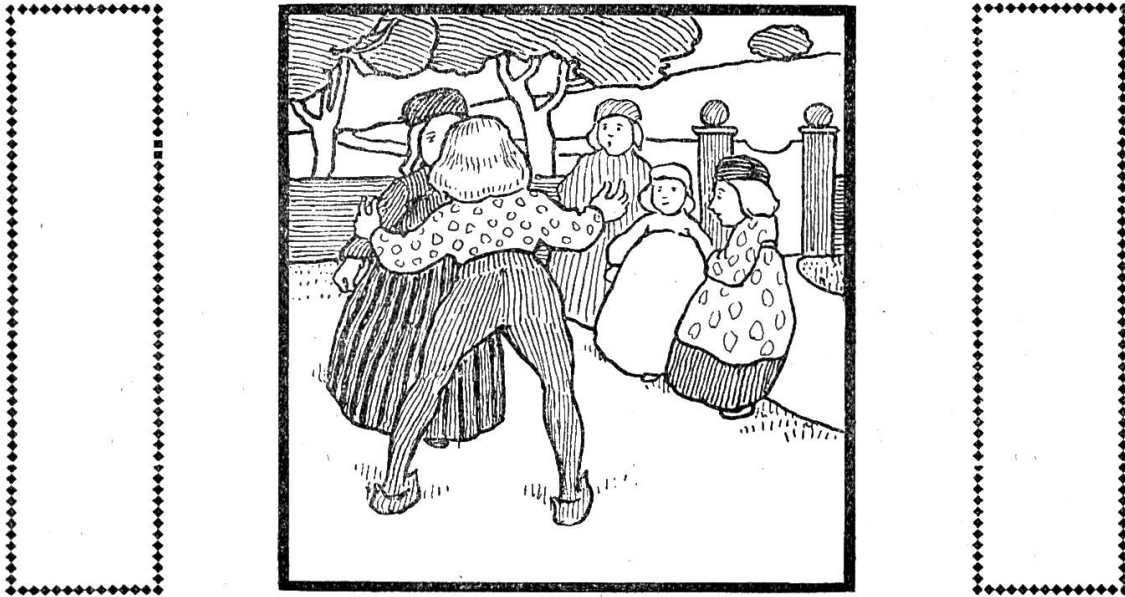
Illustration aus W. Kidd: Bäh, Schäfchen, Bäh.

In kräftigem Kontur mit guter flächenhafter Behandlung in Farben sind die kindertümlichen Bilder von Will Kidd in Bäh, Schäfchen, Bäh , mit Versen von Fritz Fink (Basel, Ernst Fink, Fr. 2. 50). Eine gute künstlerische Empfindung spricht aus diesen farbenfrohen Bildern, die dem Kinde viel Vergnügen machen.