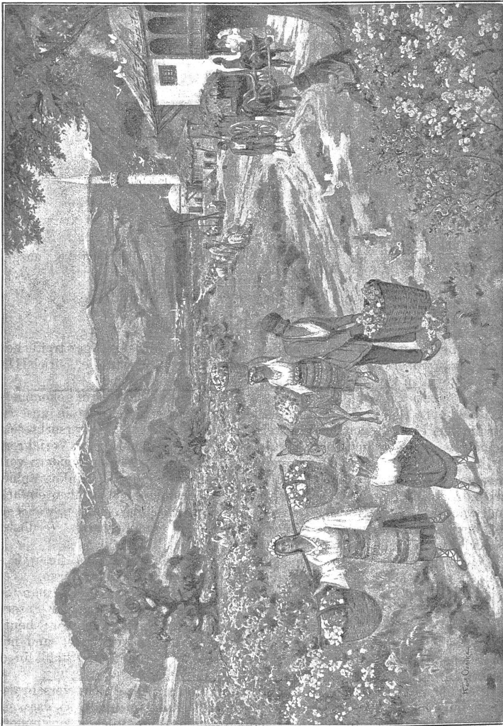
Rosenernte am Balkan.

mit der menschlichen Ansiedelung, und endlich über die Fischerszene, beim andern über den Balkan, diese wichtige Klimascheide, seine Pässe, namentlich den geschichtlich berühmten Schipkapass, über die herrlichen Rosenfelder auf der Südseite des Gebirges, sowie über die gemischte Bevölkerung dieser Landschaft.