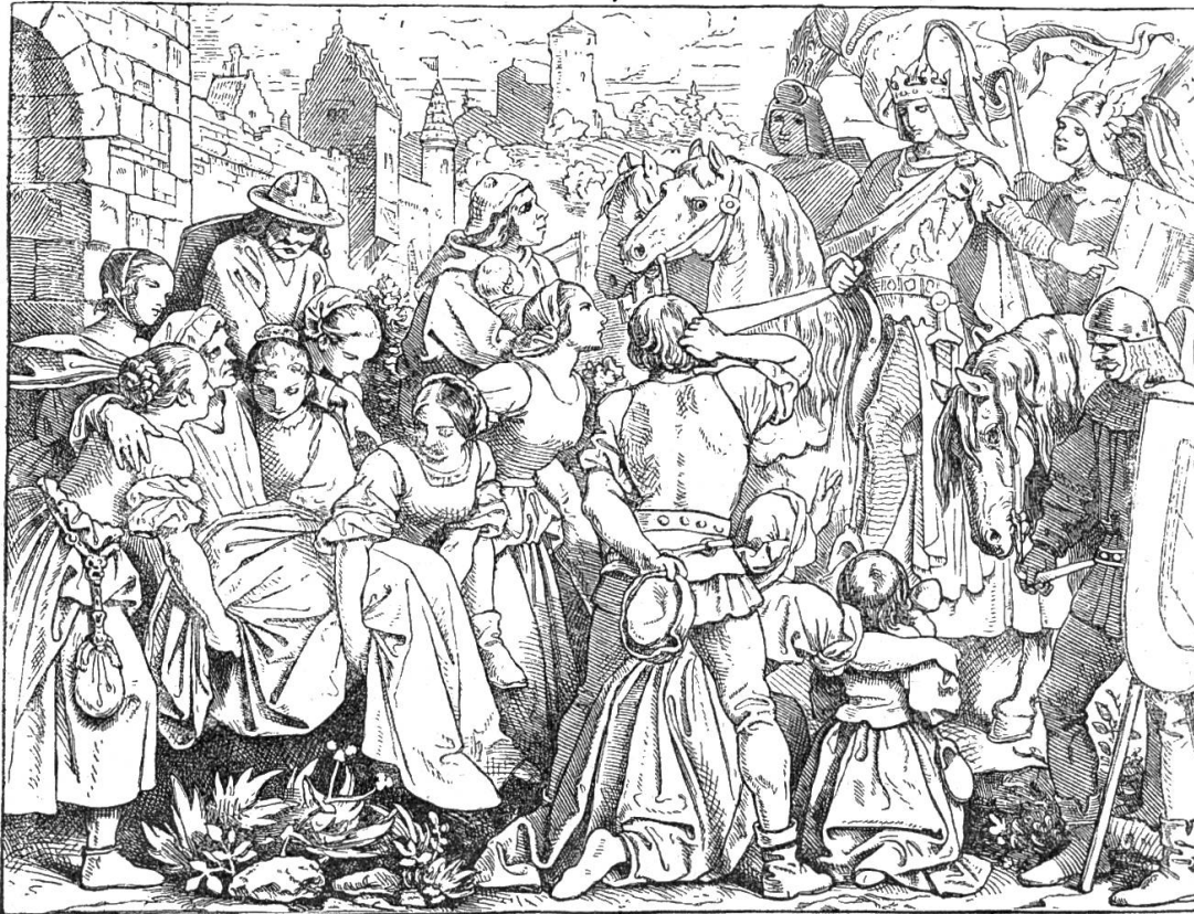
Die Weiber von Weinsberg.