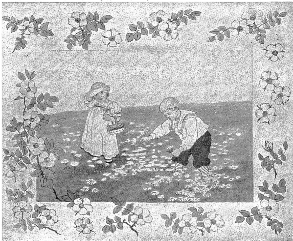
Auf der Wiese.

pfleger, der doch über kurz oder lang an die Anschaffung einer neuen Karte denken sollte . Es darf gewiss extra auf diese mannigfachen kleinen und grossen Ärgernisse hingewiesen werden. In desto helleres Licht werden dann die Vorteile gerückt, welche eine ideale Kartenlage bietet.