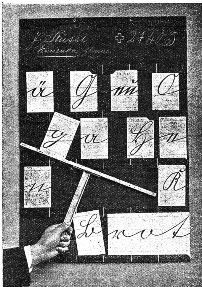
Natürliche Grösse der Tabellen 54 × 78 cm.