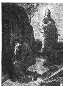
Hofmann: Jesus und die Samaritaner.