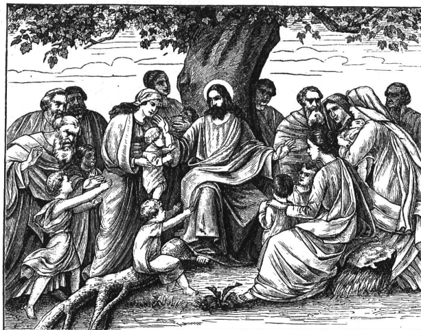
Wangemann: Der Heiland segnet die Kinder.