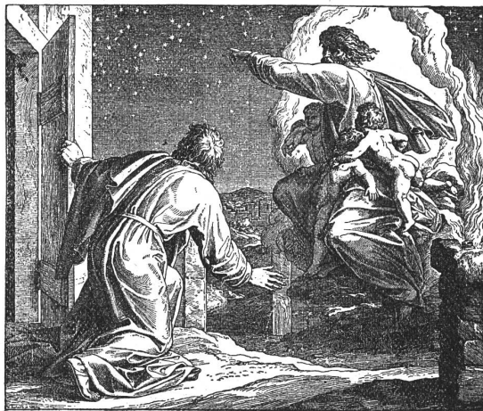
Schnorr von Carolsfeld: Abraham empfängt die Verheissung.