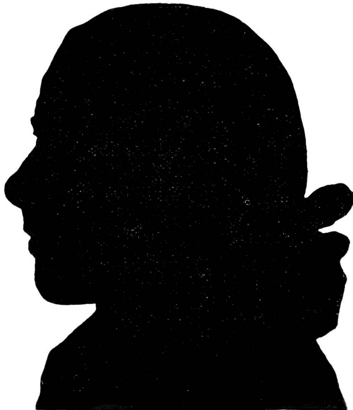
Silhouette von Pestalozzi.