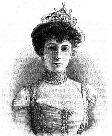
La reine Maud de Norvège.