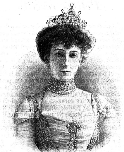
La reine Maud de Norvège.