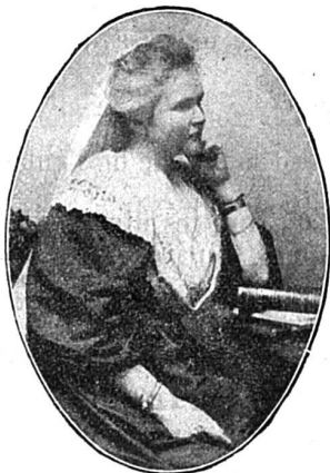
Elisabeth, reine de Roumanie.

Elisabeth, reine de Roumanie, que le monde entier connaît sous son gracieux pseudonyme de Carmen Sylva, est certainement une des physionomies les plus intéressantes et les plus sympathiques parmi les souveraines de notre temps.