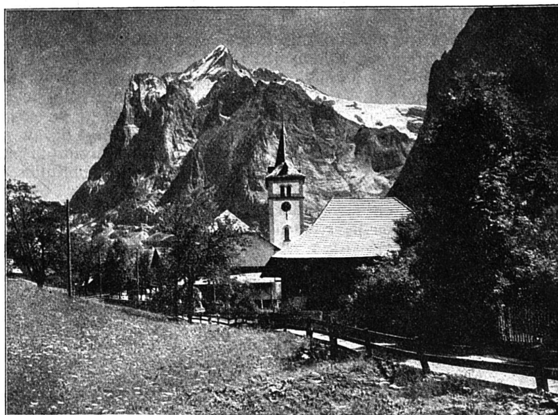
Grindelwald en hiver. — Au premier plan, l'église; au fond, le Wetterhorn.