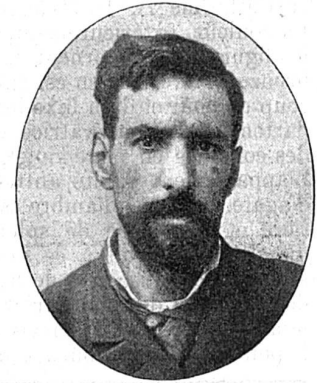
Savorgnan de Brazza.

En 1882, Brazza, épuisé par l'effort donné, rentre en France. L'accueil qu'il reçut fut des plus chaleureux. Les Chambres approuvèrent à l'unanimité, et après des rapports élogieux, le traité Makoko. Le gouvernement prend en mains l'affaire du Congo. Une nouvelle mission, dite « mission de l'Ouest africain », est confiée à de Brazza, qui prend le titre de commissaire du gouvernement de la République dans l'Ouest africain (1883). Pendant trois années (de mars 1883 à décembre 1885), avec ses hardis compagnons de Chavannes, Dolizée, Fourneau, Decazes, son frère, Jacques de Brazza, qui mourut au retour, Potrel, Blom et tant d'autres, il parcourut en tous les sens et fit reconnaître la région comprise entre le Gabon et le Congo, leva le cours du grand fleuve jusqu'à l'Oubanghi et maintint l'occupation française sur les deux rives du Pool. Aussi, le retour de l'explorateur fut-il pour lui l'occasion d'un véritable triomphe, quand, le 21 janvier 1886, au Cirque d'Hiver, des milliers d'auditeurs acclamèrent frénétiquement « le voyageur intrépide qui, avec des moyens restreints et sans verser une goutte de sang, était aller planter le drapeau français sur la route de l'Afrique centrale. »