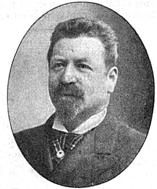
Francesco Tamagno. |

Tamagno fut, peut-être, le plus robuste et le plus brillant des « forts ténors » depuis la disparition des Duprez et autres interprètes de l'ancien répertoire.