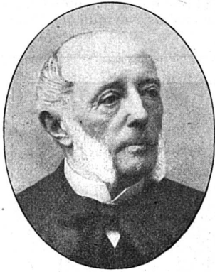
René Goblet, ancien président du conseil.

M. René Goblet est mort le 13 septembre dernier, à Paris, succombant à la crise d'asthme qui l'étreignait cruellement depuis quelques jours.