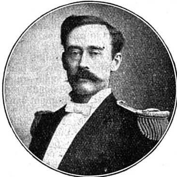
Commandant Robert Peary.

La dernière en cours est celle du commandant Robert Peary, un vieux connaisseur des glaces polaires, un ardent pionnier travaillant dès longtemps pour la science dans ces inhospitalières régions de notre planète. Il a déjà effectué sept expéditions vers le Pôle nord et il vient de faire sa huitième.