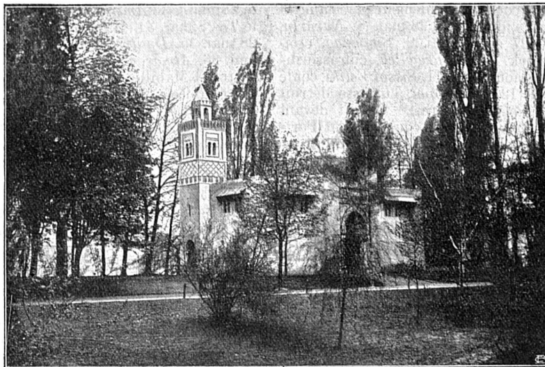
Colonies françaises : Régence de Tunis.

Fabrique nationale d'armes de guerre de Herstal ; tout près encore, sont les grandes usines Cockerill, de Seraing, qui peuvent rivaliser avec celles de Krupp et celles du Creusot. A Angleur, c'est l'usine de la Vieille-Montagne, où l'industrie du zinc a pris naissance et qui est aujourd'hui l'un des établissements les plus importants en son genre. Enfin, ce sont les verreries du Val St-Lambert, une des plus grandes fabriques de verre du continent.