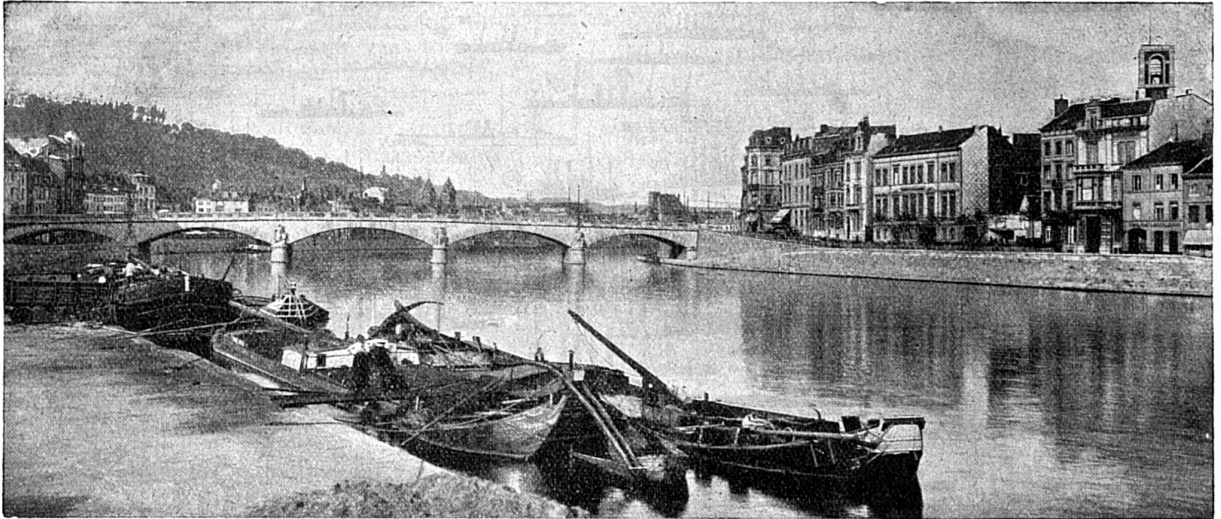
Liège : Pont des Arches sur la Meuse.

La vue de la ville en son ensemble donne bien l'impression de l'industrialisme moderne. C'est que dans les entrailles de sa terre s'entre-croisent les galeries de ses mines de houille qui vont de la frontière française à Namur. Le renom de Liège lui vient avant tout de ses fabriques d'armes ; tout près se trouve la