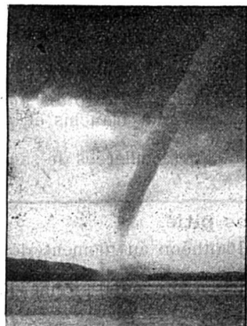
Une trombe sur un lac suisse.

Un phénomène dont nous prenons la théorie à l'école, mais qui est extrêmement rare dans nos contrées, s'est produit le lundi 19 juin sur le lac de Zoug. Nous voulons parler de la formation d'une trombe.