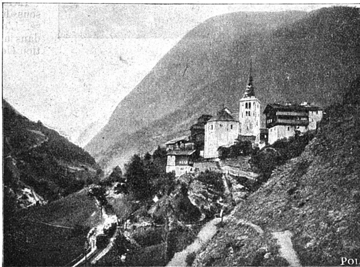
Village de Stalden.

En quittant Saint-Nicolas, la voie traverse un joli vallon cultivé, et bientôt apparaissent au loin les neiges du Breit-horn ; à droite le Weisshorn (4513 m) et à gauche les Mischabel . On repasse la Viège avant d'arriver à la halte de Herbruggen . Encore une rampe à crémaillère de près de 2 kilo-