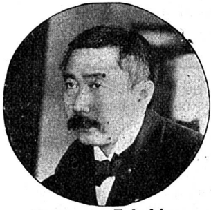
M. Kogoro-Takahira ambassadeur à Washington.

Russes et Japonais ayant accepté les offres amicales de M. Roosevelt en faveur de la paix, les deux belligérants ont choisi leurs plénipotentiaires. Le Japon est représenté par M. Kogoro Takahira, ambassadeur à Washington, et par le baron J. Komura, ministre des affaires étrangères. Ce dernier est arrivé aux États-Unis où ont lieu les négociations en vue de la conclusion de la paix.