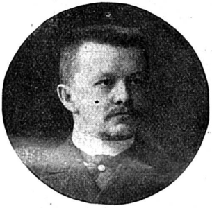
M. N.-W. Mourawieff ministre près le Quirinal.

mais encore celle des nations civilisées, grâce à son caractère loyal et honnête. Les États-Unis, sous sa présidence, ont gagné en puissance et en considération auprès des nations étrangères, de sorte que tous les Américains ont le droit de se montrer reconnaissants envers leur « Teddy ». Que n'a-t-il pas fait depuis trois mois pour essayer d'amener la Russie et le Japon à mettre fin à cette guerre inhumaine et sanglante qui n'a que trop duré. Ses efforts semblent vouloir être couronnés de succès.