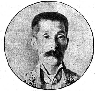
Baron J. Komura ministre des affaires étrangères.

La Russie avait, semble-t-il, plus de peine à trouver des négociateurs. Pour des raisons diverses, M. de Nélidoff et le comte Lamsdorf refusèrent cette mission. Nous publions les portraits des deux plénipotentiaires qui, au premier moment, étaient nommés par le tsar; ce sont le baron de Rosen, ministre russe à Washington, et M. N.-W. Mourawieff, ministre près le Quirinal. Ce dernier ayant encore refusé, Nicolas II