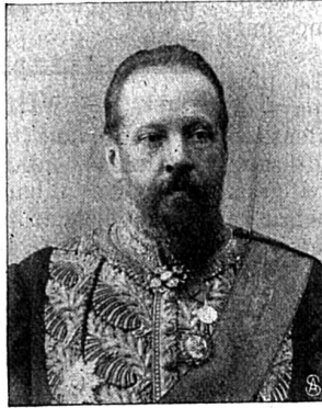
M. J. de WITTE président du conseil des ministres premier plénipotentiaire de paix.

Serge Jouliévitch de Witte occupe une situation prépondérante en Russie. D'origine hollandaise, du côté paternel, il est né à Tiflis en 1849. Il fit ses études à l'université d'Odessa et entra dans l'administration des chemins de fer dans laquelle il devint directeur. En 1892, il fut nommé ministre des finances, après avoir été auparavant gérant du ministère des voies et des communications. Son nom restera attaché à l'achèvement du chemin de fer transsibérien. En 1903, Nicolas II le nomma président du conseil des ministres.