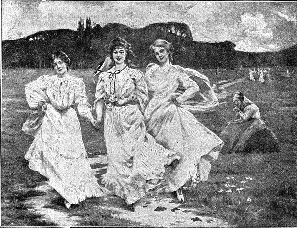
Jeunesse qui passe, d'après le tableau de M me Delacroix-Garnier.

Dans la plaine, les gazons verdissent pour te parler d'espoir et se fleurissent pour te sourire.