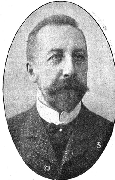
Christian Michelsen président du ministère norvégien.

les Norvégiens ne trouvaient pas de tête à couronner, ils s'érigeront en république, ce qui réjouirait le grand écrivain Bjørnsen, mais rendrait plus difficiles leurs relations avec les puissances étrangères.