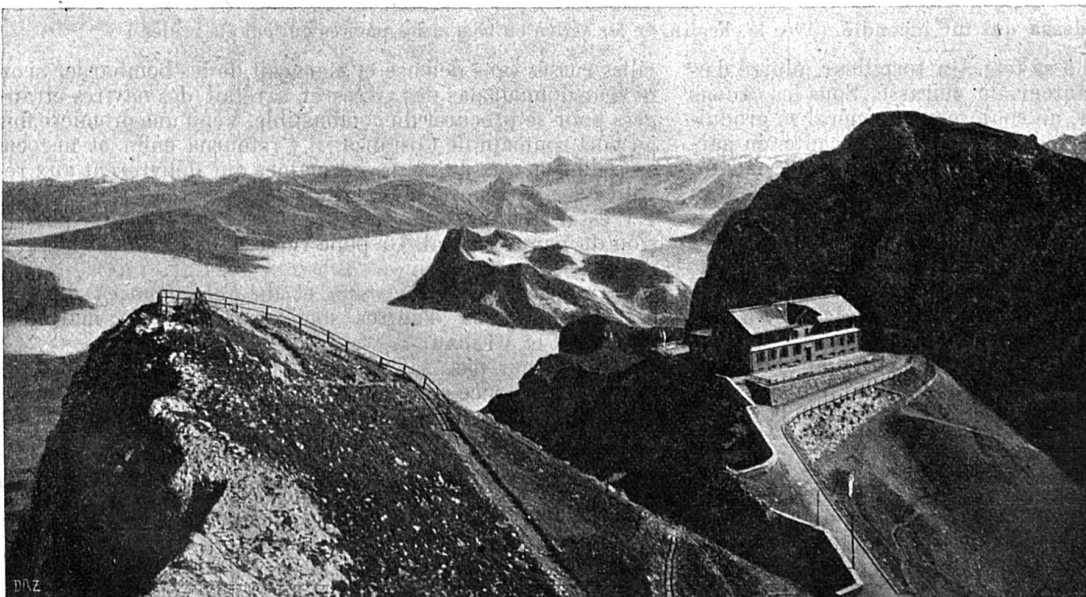
Panorama du Pilate. — Vue sur le lac des Quatre-Cantons, le Rigi, etc

Dans un cas comme dans l'autre, le mot « péquin » aurait donc les origines les plus lointaines.