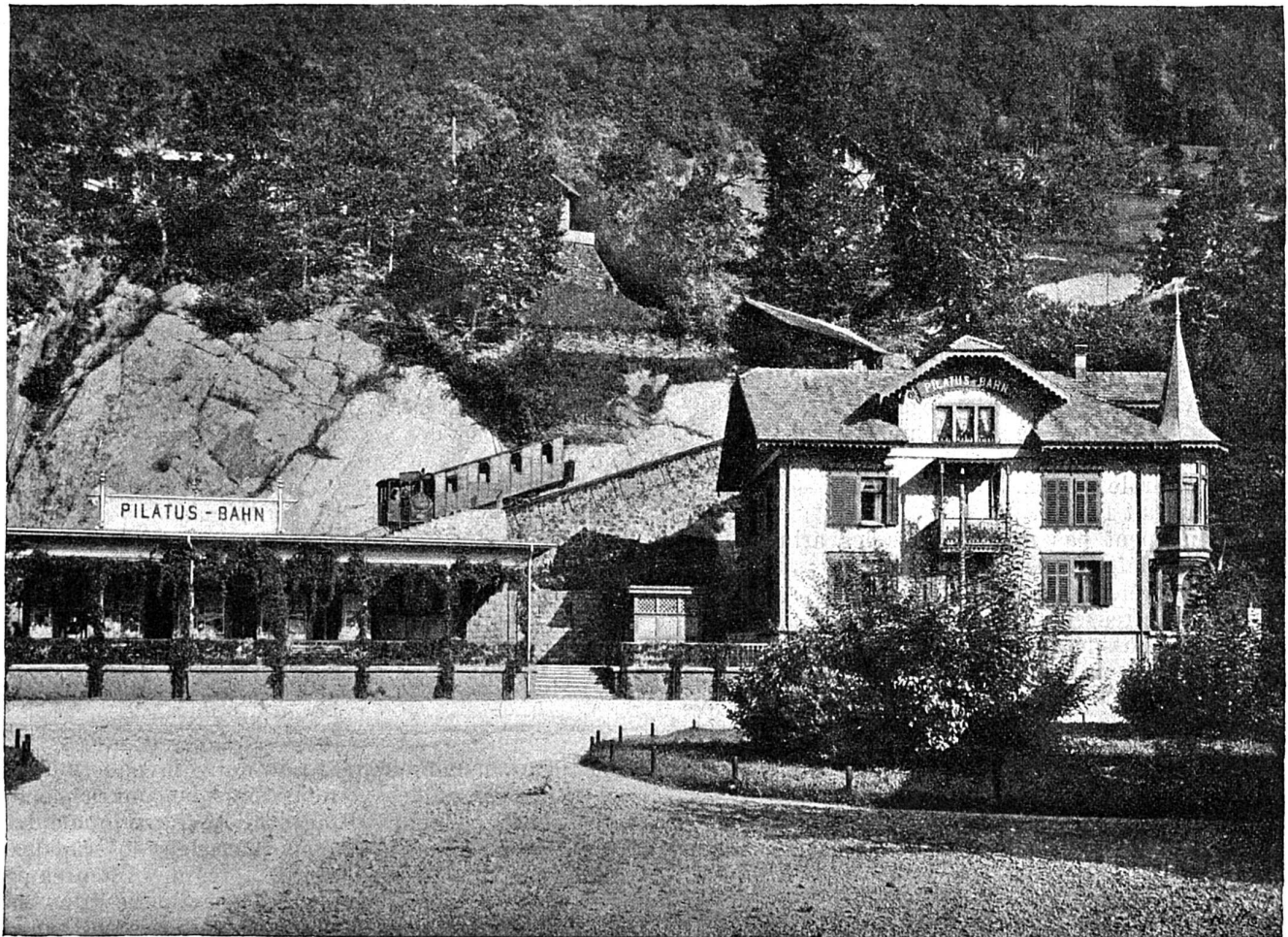
Alpnachstad, point de départ du chemin de fer du Pilate.