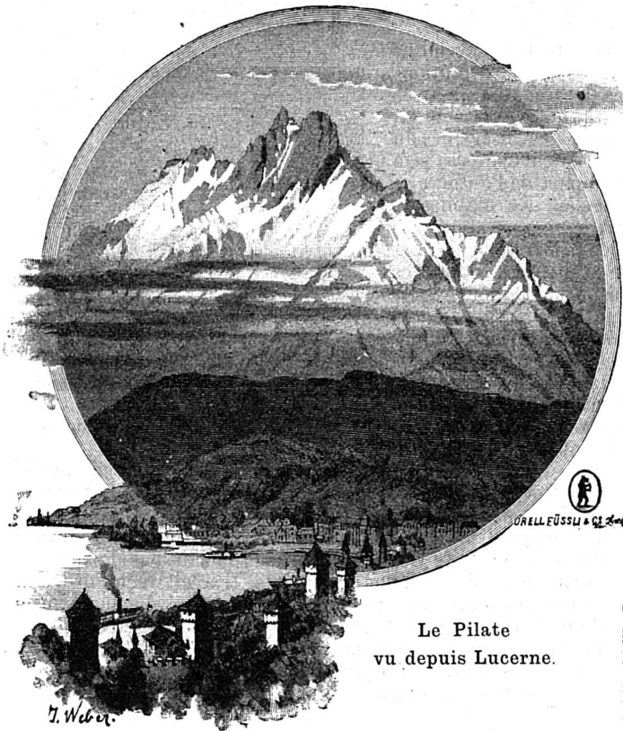
Le Pilate vu depuis Lucerne.