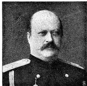
Comte Ignatieff, dictateur d'Odessa.

Les événements récents d'Odessa ont donné aux révolutionnaires l'occasion de faire une manifestation sans précédent dans l'empire des tzars. Sur un vaisseau amiral, le cui-