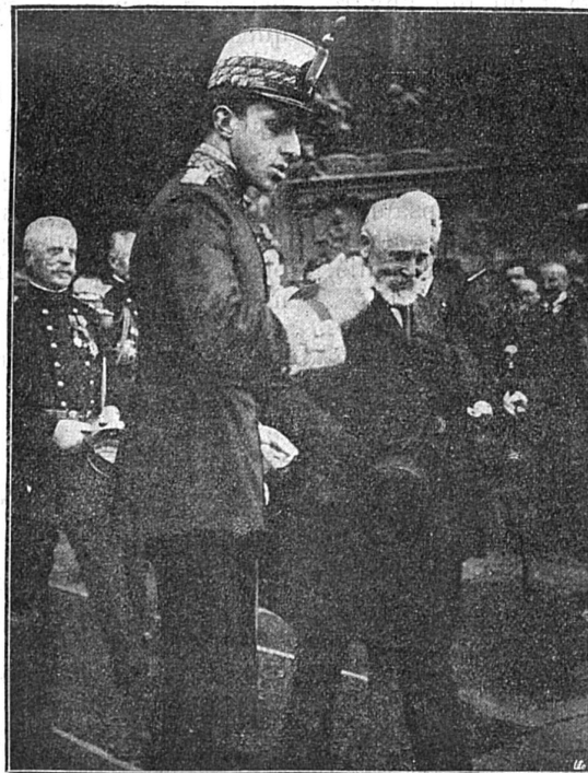
VISITE DU ROI D'ESPAGNE A PARIS

Le soleil avait escaladé les cimes de l'Uetliberg. Tout le panorama d'une pente boisée s'éclairait. Le panorama de Zurich aussi; il en ressortait, au-dessus d'une multitude de toits, quelques maisons et les clochers ronds du Dôme dont l'un porte, à bord de fenêtre, le Charlemagne germain, tout en or. Derrière Zurich, une montagne s'entassait; et, à sa gauche, des collines s'affaissaient vers Höngg tout à coup enveloppées de fumée blanche crachée par une salve d'artillerie.