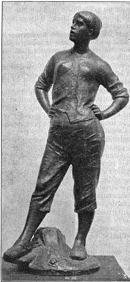
Femme du mineur