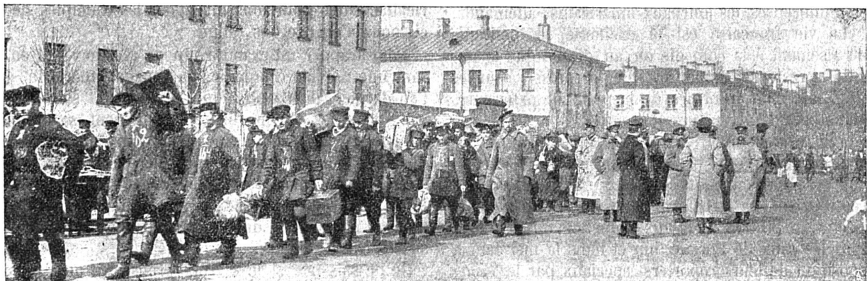
Les levées en Russie. Réservistes se rendant à la gare