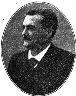
— Le nouveau ministre français de l'Intérieur, M. Etienne.