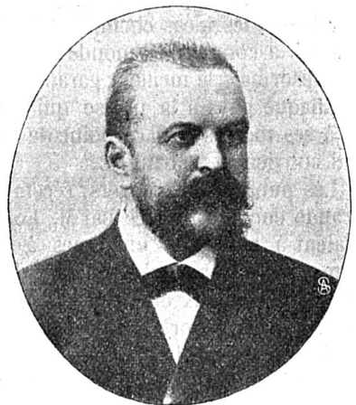
Bulygin, ministre russe de l'Intérieur.

Alexandre Grigorowitch Bulygin est né en 1851 ; il est donc âgé de 54 ans et a fait ses études de droit. En 1859 il fut nommé inspecteur des prisons et plus tard chef général. En 1881, il fut appelé au ministère de l'Intérieur, en 1886, nous le voyons vice-gouverneur de Tambow et en 1887 gouverneur de Kalouga. En 1893, il était nommé gouverneur de Moscou. Il était donc en cette qualité aide du grand-duc Serge et comme ce dernier il était très réactionnaire. Après sa nomination au poste de ministre de l'Intérieur, ses successeurs se rendirent auprès de lui, ainsi que la noblesse de Moscou et d'autres notabilités politiques, pour le féliciter et le remercier de l'équité avec laquelle il avait rempli ses fonctions pendant 11 ans. A cette occasion on lui offrit des icônes. Le ministre déclara qu'il avait été défenseur des lois et qu'il entendait le rester. « Je sais », disait-il, « quelle lourde responsabilité exige mon nouveau ministère, mais je puiserai ma force dans ces saintes images, car tout Moscou est avec moi. »