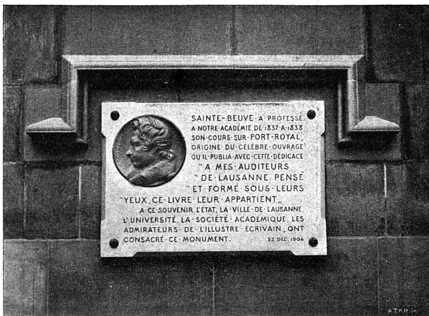
Plaque commémorative inaugurée récemment à Lausanne rappelant le cours sur Port-Royal que le célèbre critique Sainte-Beuve donna à Lausanne

SAINTE-BEUVE A PROFESSÉ A NOTRE ACADÉMIE, DE 1837 A 1838,