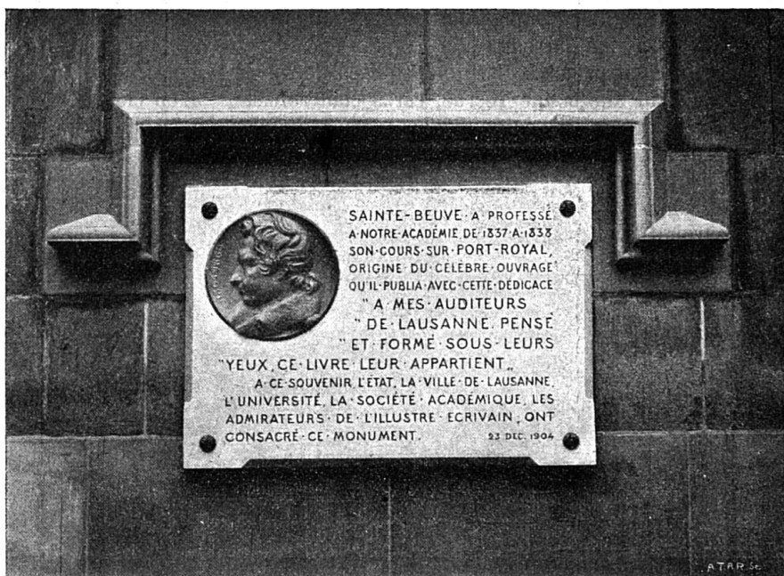
Plaque commémorative inaugurée récemment à Lausanne rappelant le cours sur Port-Royal que le célèbre critique Sainte-Beuve donna à Lausanne

SAINTE-BEUVE A PROFESSÉ A NOTRE ACADEMIE, DE 1837 A 1838,