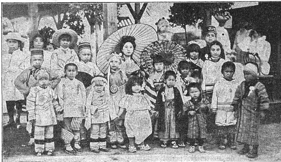
Une fête internationale d'enfants à l'Exposition de Saint-Louis

La France avait déjà conquis le royaume du prince Ham-Nghi, fils du prince Kjan-Thaï-Khong, qui était lui-même vingt-sixième fils du roi Thion-Tu.