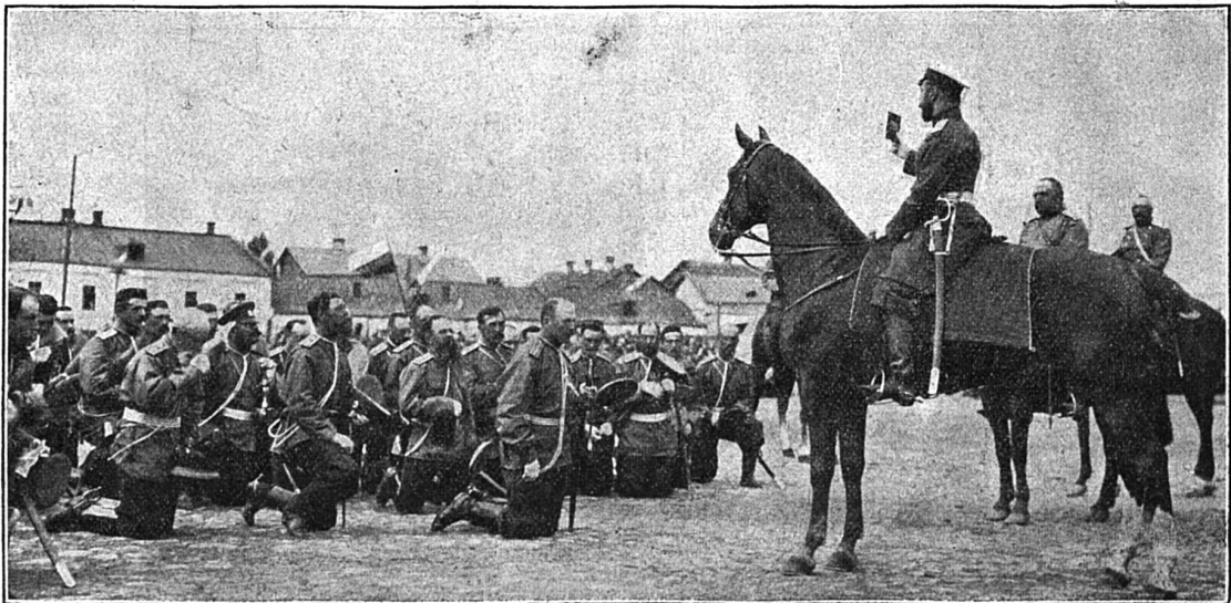
Le Tsar bénissant des troupes partant pour la guerre

Combien reviendront des plaines glacées de la Mandchourie, où se livrent depuis dix mois des combats atroces et presque sans exemple dans l'histoire ? Pars, pauvre soldat ; emporte avec toi le souvenir des paysages aimés de la mère patrie.