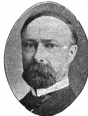
Ch. W. Fairbanks, vice-président des Etats-Unis