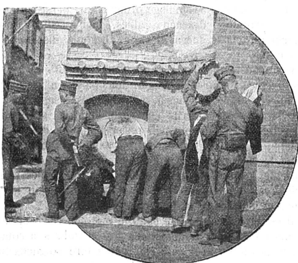
Distribution des vêtements d'hiver aux troupes japonaises

Coup d'œil sur une plaine en Extrême-Orient : Position russe prise par les Japonais ; au premier plan, Russes tués, dans le fond, Japonais avançant.