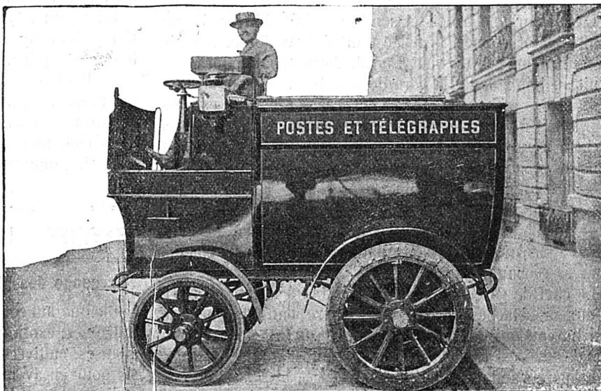
La nouvelle automobile postale de Paris