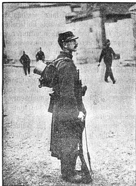
Le nouveau sac du soldat français

Le nouveau sac du soldat français. — On vient d'alléger considérablement le sac du soldat français, en enlevant les parties dures, et un certain nombre d'objets qui seront désormais transportés par les voitures. Le sac ainsi réduit ne forme qu'un paquet peu volumineux.