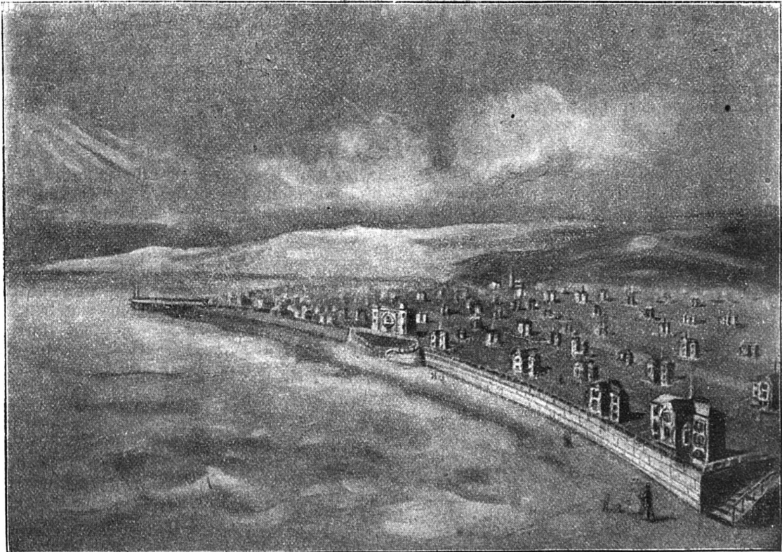
Une station balnéaire en Villas Tournesol.

Ce mode de supplication est tellement puissant au pays afghan