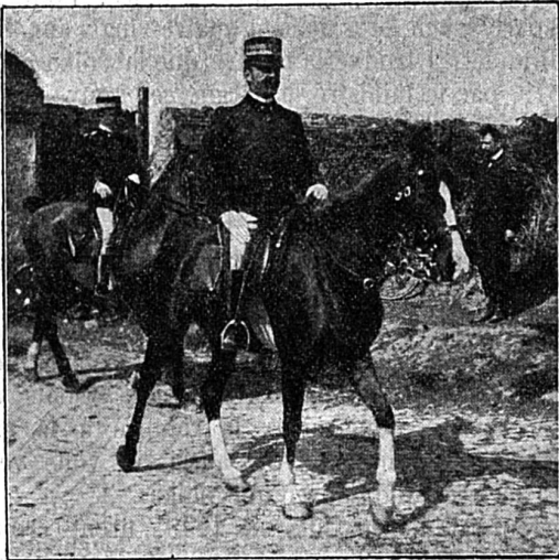
Le roi Victor-Emmanuel III revenant de la revue

Les vœux de l'Italie ont été exaucés : c'est le jeudi 16 septembre, à 10 heures du soir, que la reine d'Italie a donné naissance à un fils. Le nouveau prince a reçu le nom d'Humbert, Prince de Piémont. Beaucoup de libéraux tenaient à ce que le nouvel héritier s'appelât Prince de Rome, mais le roi désirant ne pas faire pièce au Vatican a préféré donner à son fils le nom d'Humbert, nom douloureusement illustré par le régicide et qui est resté cher au peuple italien. Pie X s'est montré très satisfait de la résolution du roi et s'est publiquement félicité du tact qu'a montré Victor-Emmanuel III en cette circonstance.