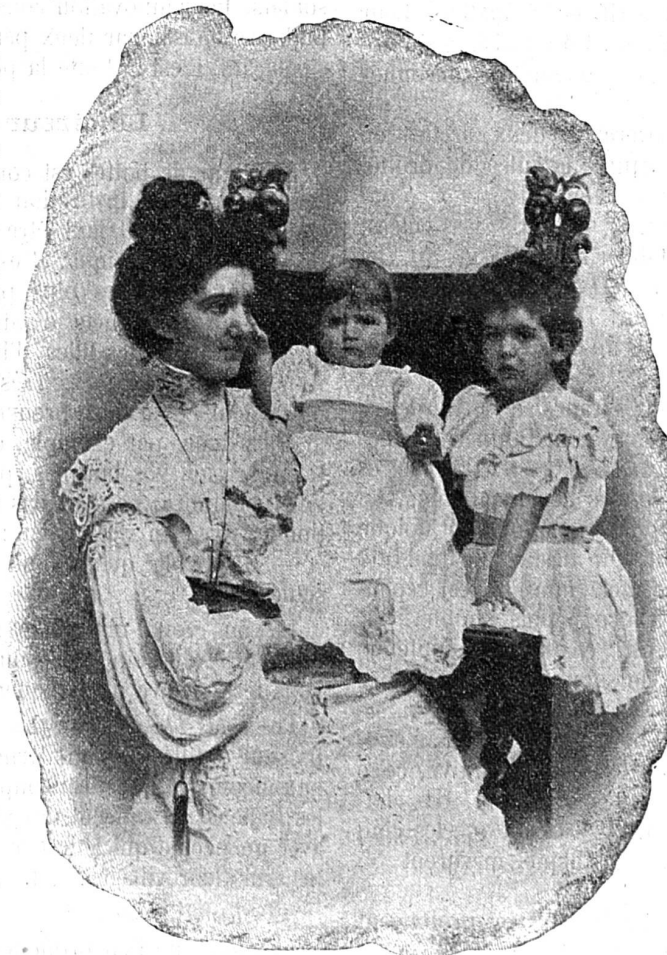
La reine Hélène avec ses deux filles

Le roi d'Italie a épousé Hélène de Monténégro au mois d'octobre 1896. Ce mariage, chose rare dans les familles royales, fut surtout un mariage d'inclination et, plus que cela, un mariage d'amour. De cette union naquit, à Rome, le 1 er juin 1901, la princesse Yolande et, le 19 novembre 1902, également à Rome, est née la princesse Mafalda. Ce sont ces deux enfants royaux que représente la gravure. Bien que le couple royal fût encore jeune, l'opinion publique commençait à s'inquiéter. A défaut d'héritier