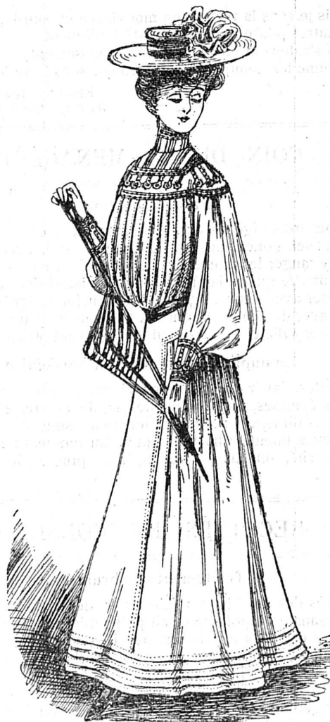
Toilette de jeune fille en tissu fantaisie.

Corsage à plis piqués; empiècement garni de galon.