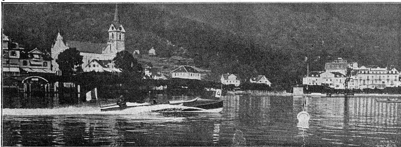
Régates de Lucerne (deuxième journée). — La Râpée III au virage de la bouée de Veggis

Les courses en canots - automobiles, à Lucerne, qui ont eu lieu les 10 et 12 septembre derniers ont été couronnées d'un succès peu accoutumé. Quoique ce fut la première année du meeting et malgré des prix modestes, les premiers canots de l'Europe s'étaient donné rendez-vous à Lucerne.