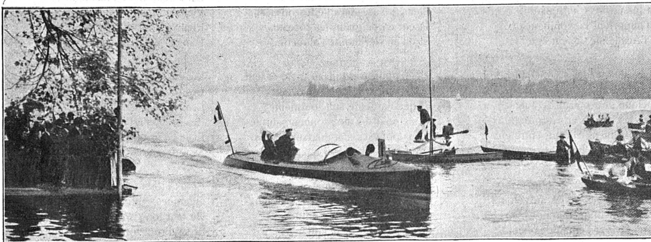
Régates de Lucerne (deuxième journée). — Arrivée du Hotchkiss