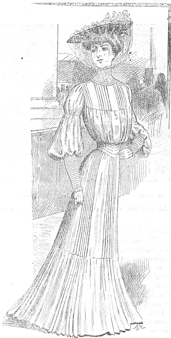
Toilette de jeune femme en toile gris perle :

Peu de liquides, pas de graisse, pas d'acidité, pas de crudité. Eviter les ragouts, les sauces ; manger, de préfé- rence, des viandes grillées, des légumes en purée, ou préparés à l'anglaise, c'est-à-dire cuits à l'eau, avec un morceau de beurre au dernier moment (non cuit), des pâtes, nouilles, riz, macaronis ; des fruits cuits.