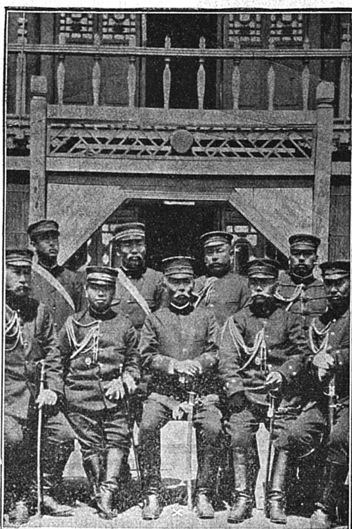
Général Kuroki avec son état-major en Mandchourie

il était promu capitaine en récompense des services rendus à l'empereur.