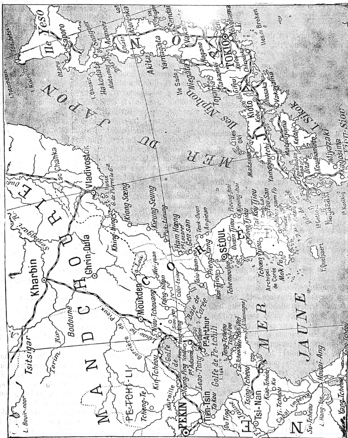
Carte du Japon, de la Corée et de la Mandchourie

Nous donnons aujourd'hui la carte non-seulement de Corée et de Mandchourie, où se déroulent actuellement les graves événements de la guerre russo-japonaise, mais aussi celle de l'archipel nippon. On n'ignore pas que l'escadre de la Baltique arrivera bientôt en Extrême-Orient où, de concert sans doute avec la flotte de Vladivostok, elle accomplira de nombreux raids dans la mer du Japon et sur les côtes orientales de l'empire du Mikado. — A l'heure où nous écrivons ces lignes, l'escadre de Port-Arthur est dispersée dans les ports chinois et presque anéantie. On s'attend à chaque instant à la chute de la forteresse qui tombera certainement au pouvoir des Japonais.