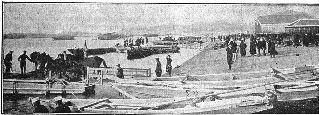
Embarquement d'un transport japonais à Kobé

Kobé est rallié par une voie ferrée à la capitale Tokio.