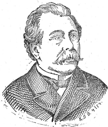
Ministre de Plehwe

Les attentats des anarchistes se multiplient en Russie. Le ministre de l'Intérieur Plehve a été tué par une bombe, le 28 juillet écoulé, alors qu'il se rendait auprès du tsar. Le crime a été commis sur le pont près de la gare Varsovie ; à droite du pont se trouve un restaurant. Un jeune homme qui se trouvait à la fenêtre de l'établissement observait attentivement ce qui se passait dans la rue ; lorsqu'il aperçut la voiture du ministre, il jeta de la fenêtre une bombe qui fit explosion, selon les uns, dans la voiture, selon d'autres, dessous. Le ministre eut la tête emportée et il ne resta de l'équipage que les roues de derrière. Toutes les vitres de la gare volèrent en éclats.