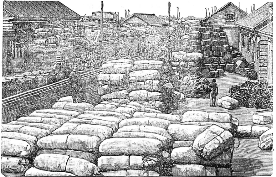
Magasins d'approvisionnements militaires de Port-Arthur

Qui pourra nous donner la véritable sensation de la guerre ? De quelle sainte horreur devrait-on être pénétré à la pensée des malheureux en train de se massacrer et de s'ouvrir le