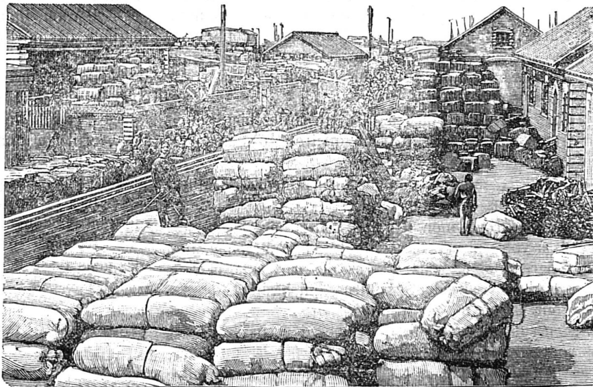
Magasins d'approvisionnements militaires de Port-Arthur

Qui pourra nous donner la véritable sensation de la guerre? De quelle sainte horreur devrait-on être pénétré à la pensée des malheureux en train de se massacrer et de s'ouvrir le