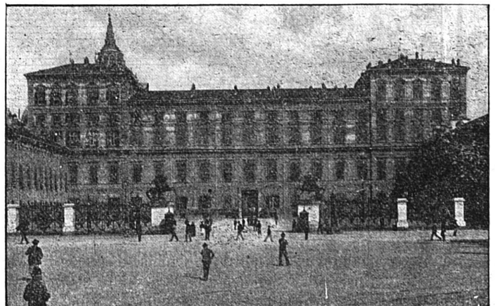
Le Palais-Royal de Turin

La situation de Turin devait en faire une très grande ville. Elle commande en effet toutes les routes des Alpes qui conduisent en France. Mais elle ne devint importante que lorsqu'elle fut la capitale du duché de Savoie (1418), puis du Piémont.