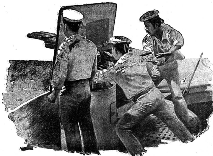
Tir d'une mitrailleuse japonaise pendant le combat

Il est à distinguer deux groupes de mitrailleuses, les unes du calibre du fusil de l'armée, employant les mêmes projectiles, les autres d'un calibre supérieur tirant des projectiles creux de fer ou d'acier. Les premières font partie de l'armement des vaisseaux de guerre anglais.