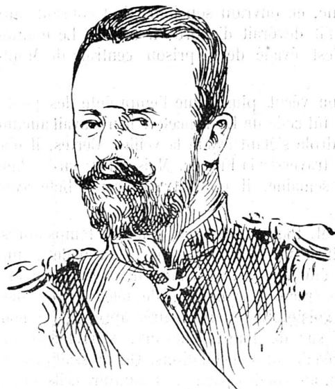
Amiral russe Skrydloff

commandant de l'escadre russe de la mer du Nord. Il avait pour mission, à l'ouverture des hostilités russo-japonaises de se joindre à l'escadre russe de Port-Arthur. Il reçut cependant l'ordre de stationner dans les eaux méditerranéennes jusqu'à l'arrivée de la flotte de la Baltique.