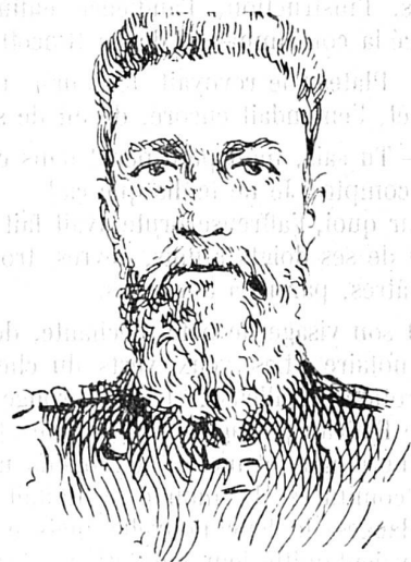
Contre-amiral russe Virenius

gouverneur en Extrême-Orient, né en 1843, depuis 1903 à Port-Arthur. Ses capacités remarquables le firent nommer au poste de commandant de l'escadre russe du Pacifique lors des troubles de Chine (soulèvement des Boxers). En 1867 il prit le commandement de la mer d'Égée. De 1875 à 1876 il accompagna le grand-duc impérial Alexandrowitch durant son voyage en Orient. De 1883 à 1893 il fut attaché de la légation russe à Paris.