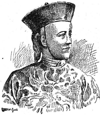
L'empereur de Chine

Né en août 1877. Il est le neuvième souverain de la dynastie man-tchoue de Tsing.