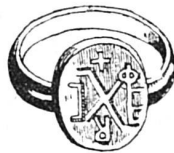
Anneau chrétien du II e siècle