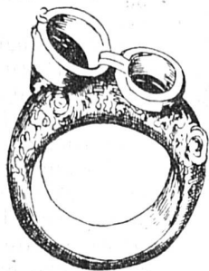
Anneau à poison

L'anneau joue dans la vie et la fantaisie humaines des rôles parfois importants : un d'eux que nous aimons en particulier, est celui qui veut que l'anneau soit le symbole de l'union mystique, d'abord, réelle ensuite, entre deux êtres qui s'aiment, c'est l'anneau des fiançailles, c'est l'alliance. Bien qu'il soit de mauvais goût de se surcharger les doigts de bagues, ce luxe s'est toutefois conservé dans nos mœurs. Il sévissait bien autrefois chez les mondains et les élégantes de l'ancienne Rome. La rage des collectionneurs s'en mêla et l'on cite des empereurs ou impératrices qui payèrent l'anneau désiré jusqu'à un million et demi de notre monnaie. Je doute, aimables lectrices, que vous poussiez la manie des collections à ce point et ne craigniez pas que vous ou vos maris dissipiez votre fortune en si coûteuses fantaisies, c'est pour-quoi je peux, sans périls, étudier avec vous quelques-