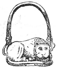
Anneau étrusque (or massif)

Au XVI e siècle, les commerçants qui, eux, n'étaient ni nobles ni officiers, voulurent cependant avoir un signe distinctif, ils le trouvèrent dans l'anneau sigillaire ; non content d'y avoir un cachet, ils y joignaient de petits objets tels que : seringue, cure-pipe, etc. Nos pères étaient exigeants, nous le sommes moins, car nos