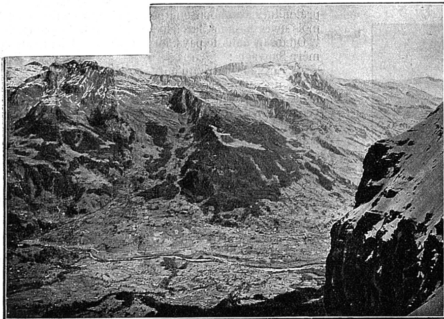
Vue prise du belvédère de la Station d'Eigerwand sur la Vallée de Grindelwald

Tout à coup, je me la rappelai telle que je l'avais vue pour la dernière fois, en 1869, propre, vêtue de vigne, avec des poules devant la porte. Quoi de plus triste qu'une maison