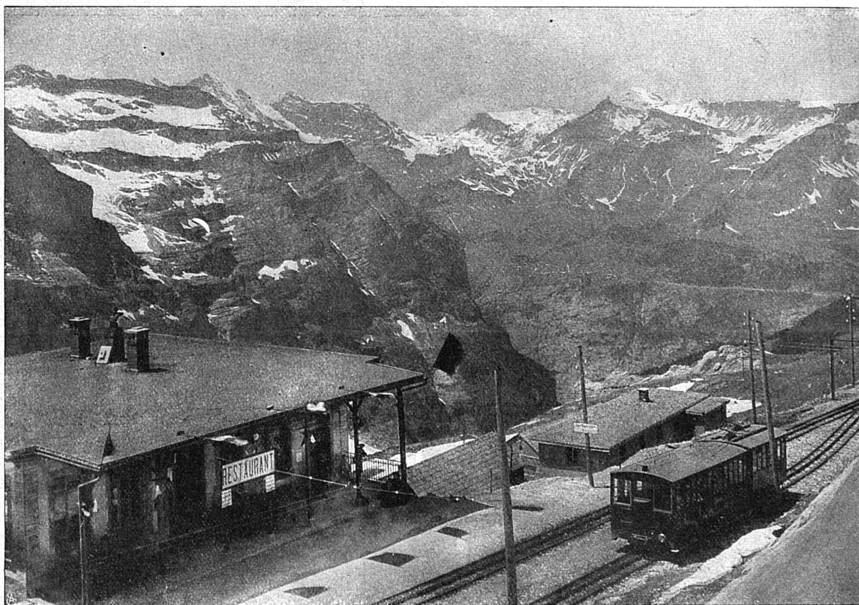
Station Eigerwandschpeli du chemin de fer de la Jungfrau. Vue sur Mürren

Le parcours de toute la ligne du chemin de fer de la Jungfrau est un chef-d'œuvre de technique remarquable, mais quelques points sont cependant à admirer tout spécialement, soit par la splendeur de la vue qu'ils offrent, soit par l'originalité du site.