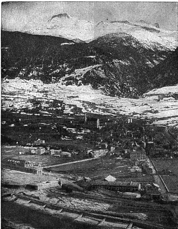
Le village de Brigue

L'on se repent rarement de parler peu, très souvent