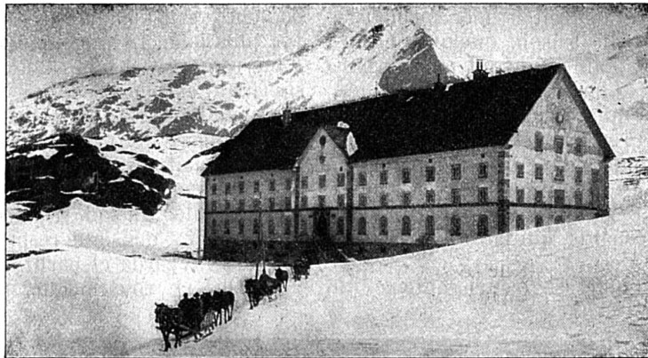
L'hospice du Simplon entre Brigue et Domo-d'Ossola, construit par ordre de Napoléon I er